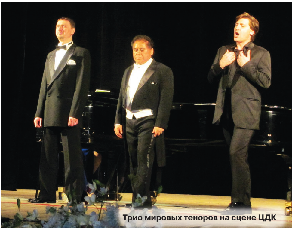
Трио мировых теноров на сцене ЦДК

- Я выступал в Голландии, Италии, Испании, на Ближнем Востоке, в Америке пока, к сожалению, не был. Но для меня как представителя Евразии, как истинно русского человека, нет лучше России. Я всегда с удовольствием возвращаюсь на родину, с каждым разом все больше понимаю, что она самая красивая и самая любимая. Ярких впечатлений масса: к примеру, интересное выступление было в Азербай-